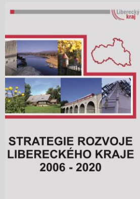
STRATEGIE ROZVOJE LIBERECKÉHO KRAJE 2006 - 2020